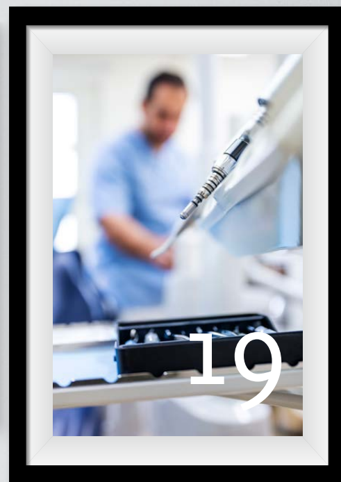
Familjetandläkaren i Blekinge AB har flyttat in i nya fräscha lokaler på Kungsmarksplan.